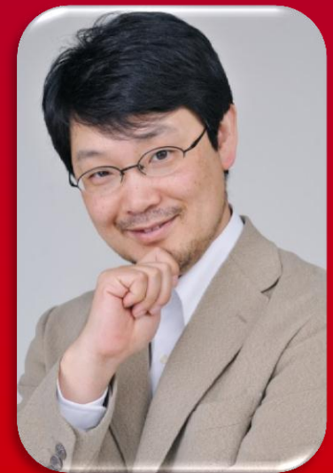
まつもとゆきひろ氏 (Matz)